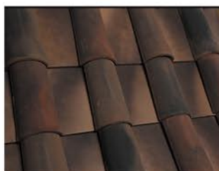
Cimarrón / Café y Negro