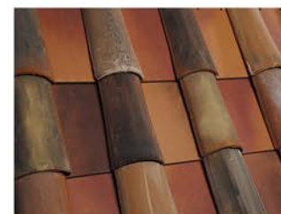
Málaga / Terracota, Rojo y Negro