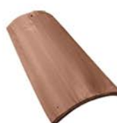
Amplia variedad de colores de la Teja Arabe