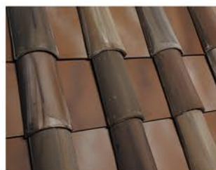
Encino / Café, Negro y Amarillo