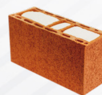
Ecomuro 14 Relleno