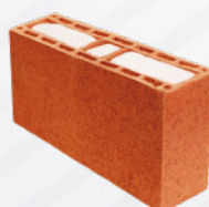
Ecomuro 12 Relleno

Al rellenar con poliestireno expandido (EPS) eleva su nivel de aislamiento térmico en los muros y genera ahorro de concreto con su relleno de EPS.