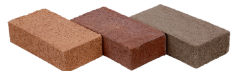
Ladrillo 1 1/2"