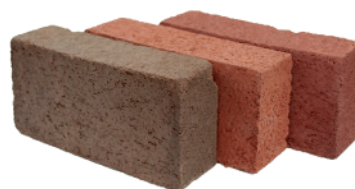
Ladrillo 2 1/4"